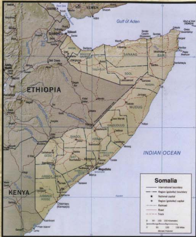
Map of Somalia

Write for your FREE DVD The Life of Jesus Christ in SOOMAALI